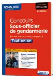
Le Tout-en-un pour une préparation complète