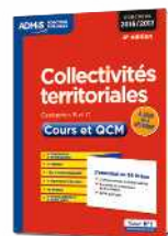
Les Fiches pour aller à l'essentiel