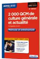
Les Entraînements pour se mettre en condition